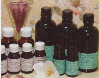
▲【オイル】マッサージオイルに調合する精油は、栄養分が高い未精製のものを使用。個々に合わせてケア