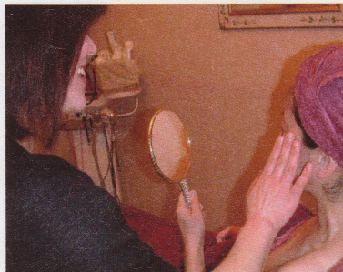
▲④ケア後は悩みに合うアドバイスとコース紹介。勧誘は一切しないので、気に入らないうちでも連絡を