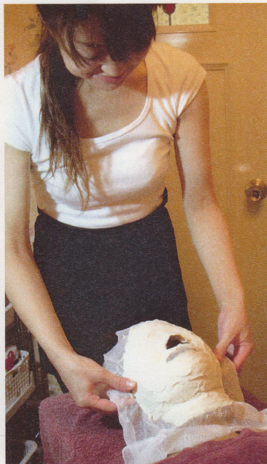
▲【石膏パック】花嫁が白肌で挙式を迎えるために効果的な、美白化粧品で贅沢に溶いたパックで仕上げ