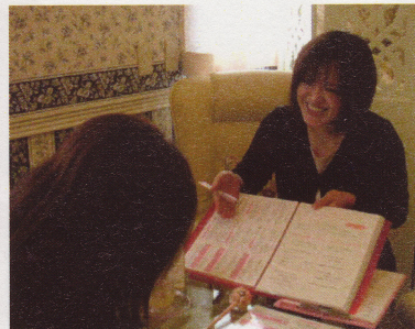
▲①普段の服装でメイクも落とさないまま来店OK。体調や肌状態をカウンセリングの上、ケアを始める