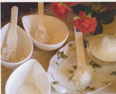
▲【汚れを落とす】5段階に分け、30分をも費やすクレンジング。肌に負担のないよう、丁寧に扱われる